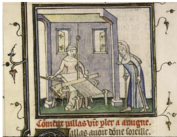
Ovide moralisé , Lyon, Bibliothèque municipale, ms. 742