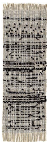
Anni Albers, Haiku , 1961

Les communications entrecroiseront les disciplines et les approches du texte poétique et des œuvres textiles. Elles porteront en priorité sur les textiles qui contiennent ou renvoient à un texte poétique et se définissent comme des poèmes ( haiku d'Anni Albers, glossolalia de Sheila Hicks, ode à l'oubli de Louise Bourgeois...), ou bien à l'inverse, sur des œuvres poétiques qui réfléchissent la pratique et la signification des arts du textile et inscrivent la poésie dans une histoire du craftivism . Pour appréhender la signification de ces œuvres hybrides et de ces références croisées, leurs contextes de production et de diffusion, leurs poétiques et leurs usages, il sera nécessaire de diversifier les savoirs et les pratiques : des spécialistes en histoire des textiles, philologie et histoire des corpus poétiques, esthétique, anthropologie et sociologie, archéologie, mais aussi études de genre et histoire du féminisme, écopoétique, subaltern studies seront invité.es à partager leurs perspectives autour de ce sujet transdisciplinaire. Seront aussi associé.es des poètes, des artisans et des artistes, à l'occasion d'expositions, de performances et d'entretiens.