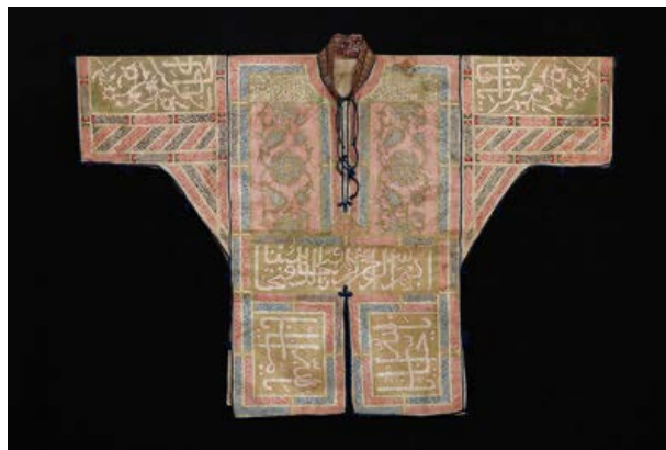
Talismanic shirt of cotton with silk buttons and borders, Exhibition “Beyond Words: Calligraphy from the World of Islam” C.L. David Foundation and Collection, Copenhagen