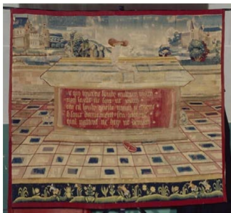
Musée national du Moyen Âge – thermes et hôtel de Cluny, tapisserie « La pirouette », version tissée d'un des Dits moraux pour faire tapisserie d'Henri Baude (n° d'inventaire : Cl. 23752)

Les communications entrecroiseront les disciplines et les approches du texte poétique et des œuvres textiles. Elles porteront en priorité sur les textiles qui contiennent ou renvoient à un texte poétique et se définissent comme des poèmes ( haiku d'Anni Albers, glossolalia de Sheila Hicks, ode à l'oubli de Louise Bourgeois...), ou bien à l'inverse, sur des œuvres poétiques qui réfléchissent la pratique et la signification des arts du textile et inscrivent la poésie dans une histoire du craftivism . Pour appréhender la signification de ces œuvres hybrides et de ces références croisées, leurs contextes de production et de diffusion, leurs poétiques et leurs usages, il sera nécessaire de diversifier les savoirs et les pratiques : des spécialistes en histoire des textiles, philologie et histoire des corpus poétiques, esthétique, anthropologie et sociologie, archéologie, mais aussi études de genre et histoire du féminisme, écopoétique, subaltern studies seront invité.es à partager leurs perspectives autour de ce sujet transdisciplinaire. Seront aussi associé.es des poètes, des artisans et des artistes, à l'occasion d'expositions, de performances et d'entretiens.