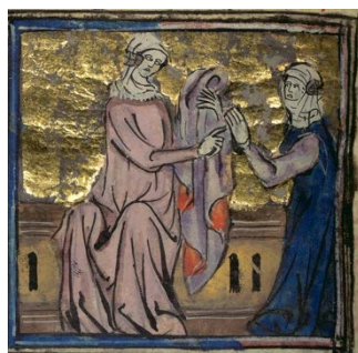
Le tissage de Philomena

Techniques ancestrales qu'on retrouve dans toutes les cultures, la tapisserie et les travaux d'aiguilles entretiennent avec la composition poétique (religieuse ou profane, traditionnelle ou expérimentale, collective, anonyme ou signée) des relations étroites qui dépassent amplement la métaphore évidente portée dans l'Antiquité latine par le mot textus – saisie de fils entrelacés –, ou bien par les images courantes empruntées au lexique du textile (trame, fil, chaîne, nœud, points, tresses, etc.) dans de nombreuses langues pour parler de poésie et de fiction. De Pénélope au craftivism contemporain, de Philomèle aux slogans brodés d'Annette Messenger, de la poésie combinatoire sur brocart de soie de Su Hui aux silk poems de Jen Bervin, en passant par les chansons de toiles médiévales, l'héritage des quipus incas ou encore les poèmes hindis de Kabîr le tisserand, des poétesses, poètes et poèmes textiles redessinent, chacun.e dans son contexte propre, les contours de la poésie en déplaçant ses modalités d'expression, ses techniques, ses supports, ses conditions de production et de diffusion, son rapport au langage et au monde.