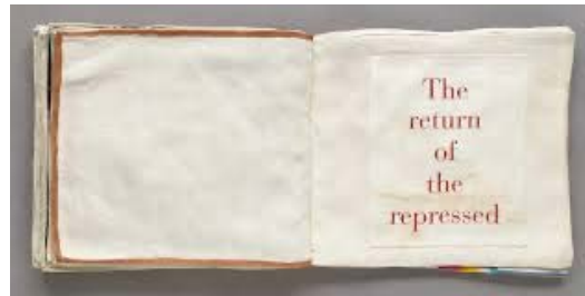
Louise Bourgeois, Ode à l'oubli (2004)

Paris (PSL, Université Paris Cité), 25 - 27 septembre 2025